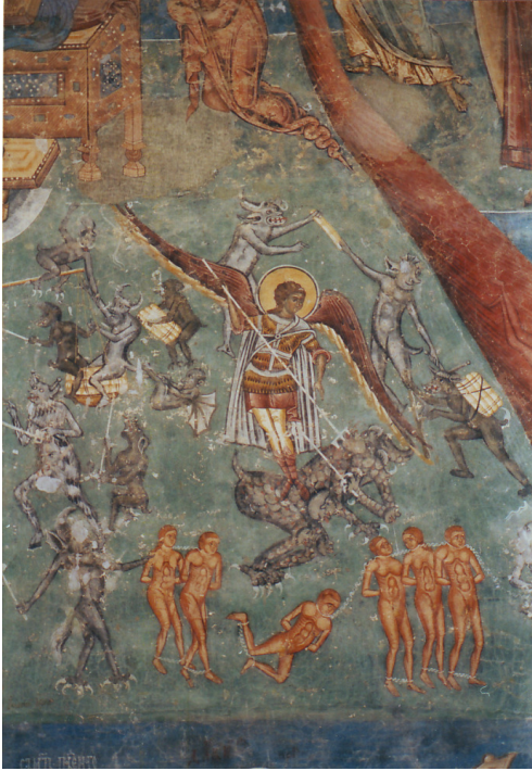
Voroneci kolostor, a végítélet-freskó részlete

Assisi Szent Ferenc (1182–1226), okt. 4.