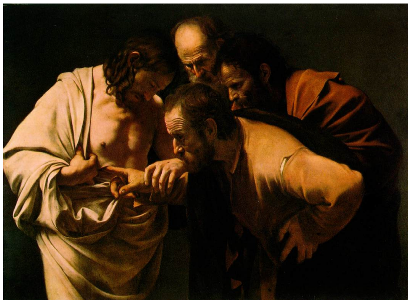
Caravaggio (1571–1610): Hitetlen Tamás, 1601-1602.