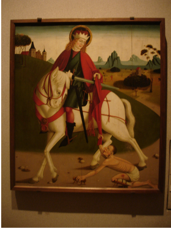
Szent Márton és a koldus, 1490 körül, Magyar Nemzeti Galéria