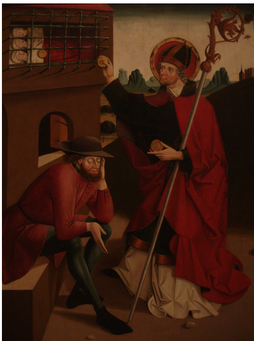
Szent Miklós és a szegény nemes három leánya, 1490 körül, Magyar Nemzeti Galéria (Lásd: Bálint 1977. I. 29.)