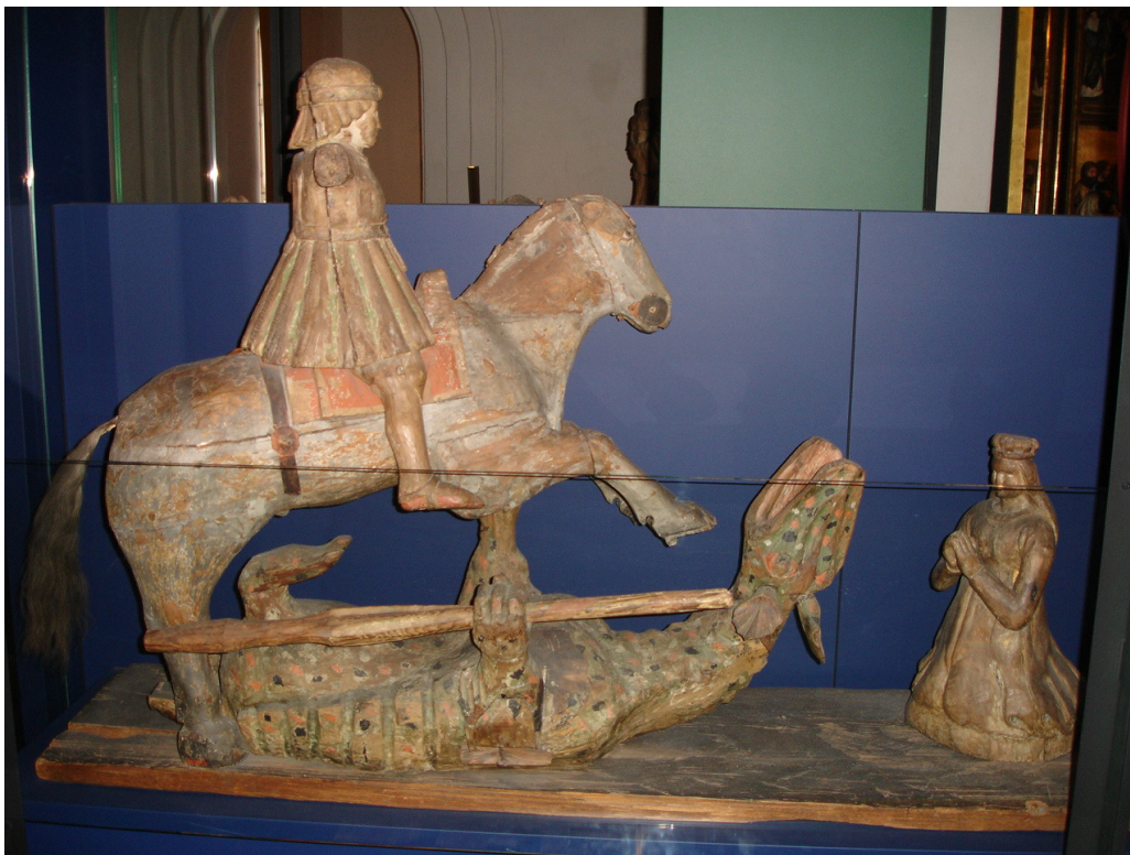
Sárkányölő Szent György, 15. század vége, Helsinki

Sárkányölő Szent György (ápr. 24.) legendás őkeresztény vértanú volt, tényleges történelmi létezését nem igazolta a történettudomány. Legendái szerint a keresztény hitre tért katonatisztnak hitéért borzalmas, hosszan tartó halálos kínzatást kellett elviselnie. A sárkány legyőzésének motívuma csak később került be legendájába, s nem egyéb egyszerű életrajzi klisénél, amit számos más szent legendájában is megtalálunk. A győzelemmel végződő sárkányviadal kifejezi azt a keresztény meggyőződést, hogy az erős hit megszünteti a démonok uralmát és a gonoszt minden alakjában legyőzi. Ezért válhatott Szent György az állatállomány védőszentjévé. A néphit szerint tavaszkezdetkor, amikor az állatok megromlására törő boszorkányok tevékenysége igen erőteljes, különösen hathatós lehet e harcosszent segítsége. Alakja a férfias helyállást, az önfeláldozást, az asszonyok tiszteletét példázza, ezért ő a lovagok, a nemesek, a cserkészek patrónusa.