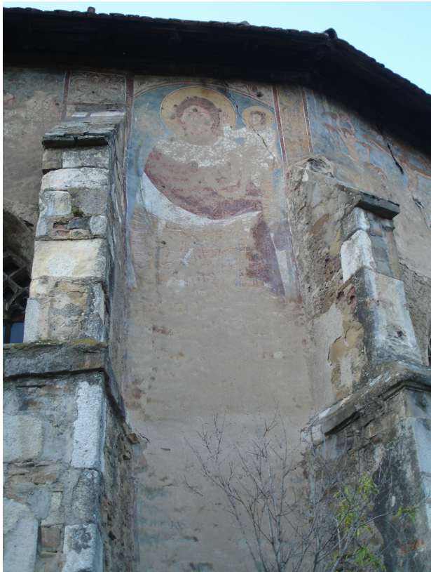
Szent Kristóf, Darlóc (Dârlos)