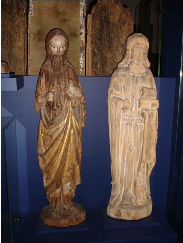
Két 15. századi svéd Keresztelő Szent János-szobor, Helsink-i Múzeum (A szent attribútuma a könyvön pihenő bárány.)

még élő archaikus népszokásunk szerint ezen az éjszakán a fiatalok, elsősorban a lányok, tűzön ugráltak át. A rituális ugrás sikerének mágikus jelentőséget tulajdonítottak, a lányok férjhez menésére jóstak. A Szent Iván-i ének a vallásos részek mellett párosító, varázsló mozzanatok is tartalmaz. Két felcsíki faluban (Csíkmadaras, Csíkszentdomokos) újraélesztett formában még ma is él a Szent János napi angyalozás nevű énekes-dramatikus népszokás. Az angyalozó csoportok – egy csoport egy csengettyűs fiúból és hét kislányból („angyalból”) áll – az ünnep napján sorra járkák a házakat, s Szent Jánost dicsőítő énekeket énekelnek, amiért ajándékokat kapnak. Felkeresik a falu utcáin előzőleg felállított imádkozó sátrakat is, melyekben az ünnep vigíliáján a rózsafüzér társulatot alkotó asszonyok imádkoznak reggelig.