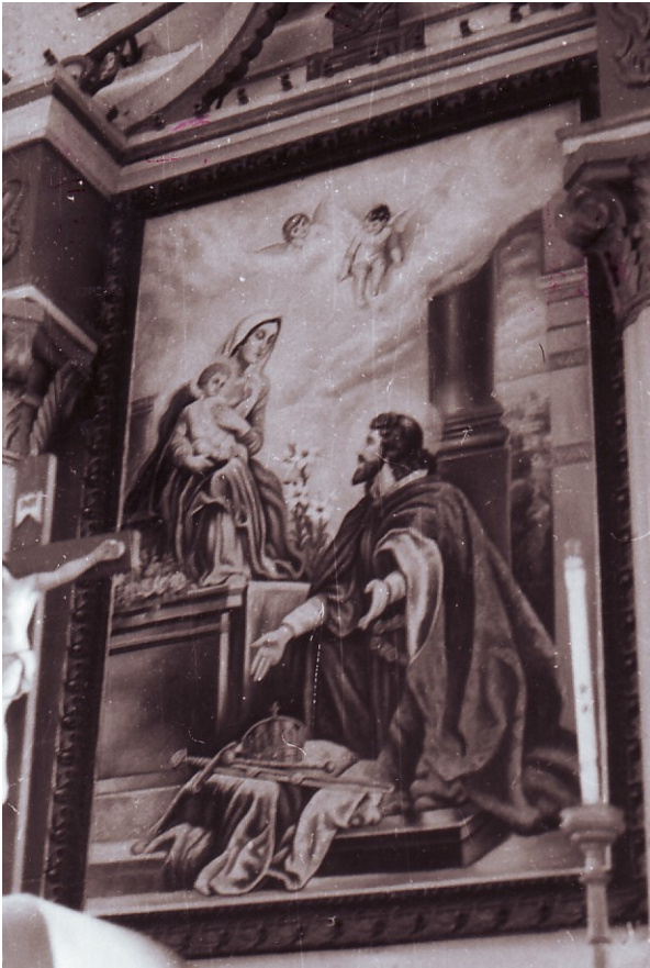
Az országfelajánlás – Pusztina (Moldva), oltárkép

nemzetet jelképezi. Szent István népi tiszteletét századokon át erősítette a hivatalos egyház kultusza: a Szent István személyéhez kapcsolódó népénekek, legendák többnyire egyházi eredetűek.