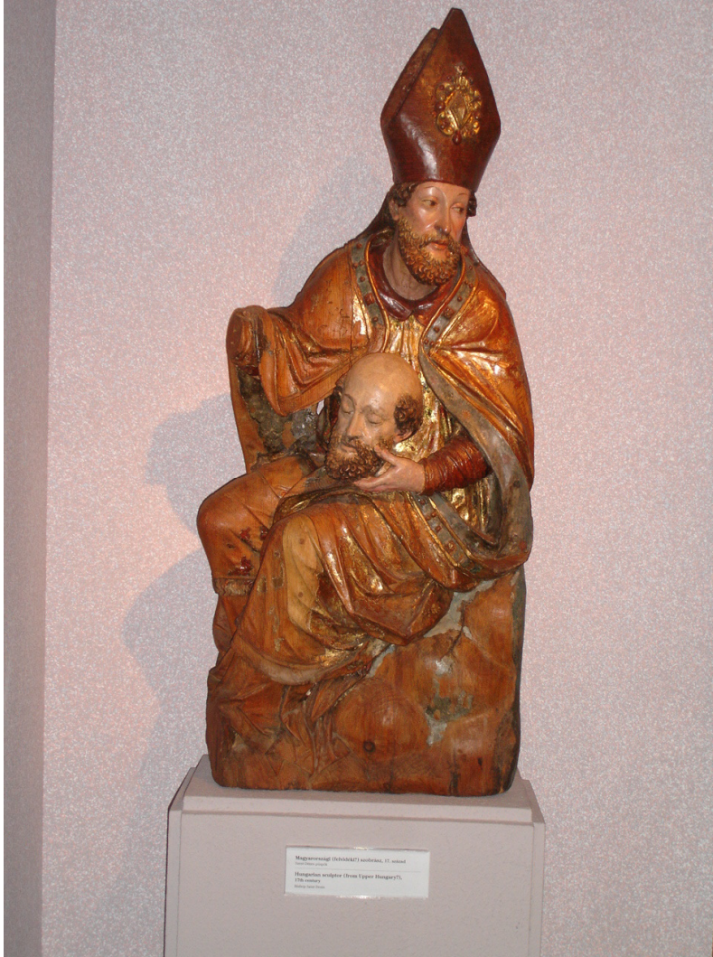
Szent Dénes püspök – Magyar Nemzeti Galéria, magyarországi szobrász alkotása, 17. század

Az archaikus időfelfogás szerint a nap egyik alkonyattól a másik alkonyatig tart. Ezért a Halottak napjához (nov. 2.) fűződő halottkultusz legtöbb megnyilvánulására már Mindenszentek (nov. 1.) napjának estéjén sor kerül. A tisztítóútzben szenvedő lelkek üdvösségét hivatottak szolgálni az ilyenkor felajánlott adományok: régen (és hagyományörzőbb vidékeken még ma is) a halott sírjánál vagy a temetőkapuban kenyeret, kalácsot, bort, gyertyát osztogattak, arra kérve a megajándékozottakat, hogy ők is emlékezzenek meg az elhunytól. Különösen fogatosnak tartották a szegények, koldusok imáját. A temetői sírok felvirágozása és a sírkeresztek megkoszorúzása csak a múlt század első felében kezdett elterjedni Magyarországon. A síron való gyertyagyújtás szokását a protestáns felekezetekhez tartozók a katolikusoktól vették át.